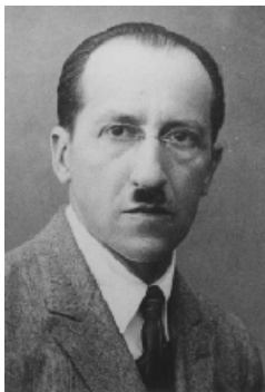
Amersfoort 1872 – New York 1944

Cette activité peinture intervient au cours de la progression sur les lignes et les carrés. Le point de départ est l'œuvre de Mondrian, Composition in Red, Yellow, and Blue . Elle est aussi l'aboutissement (observer, s'entraîner puis « re-crée »).